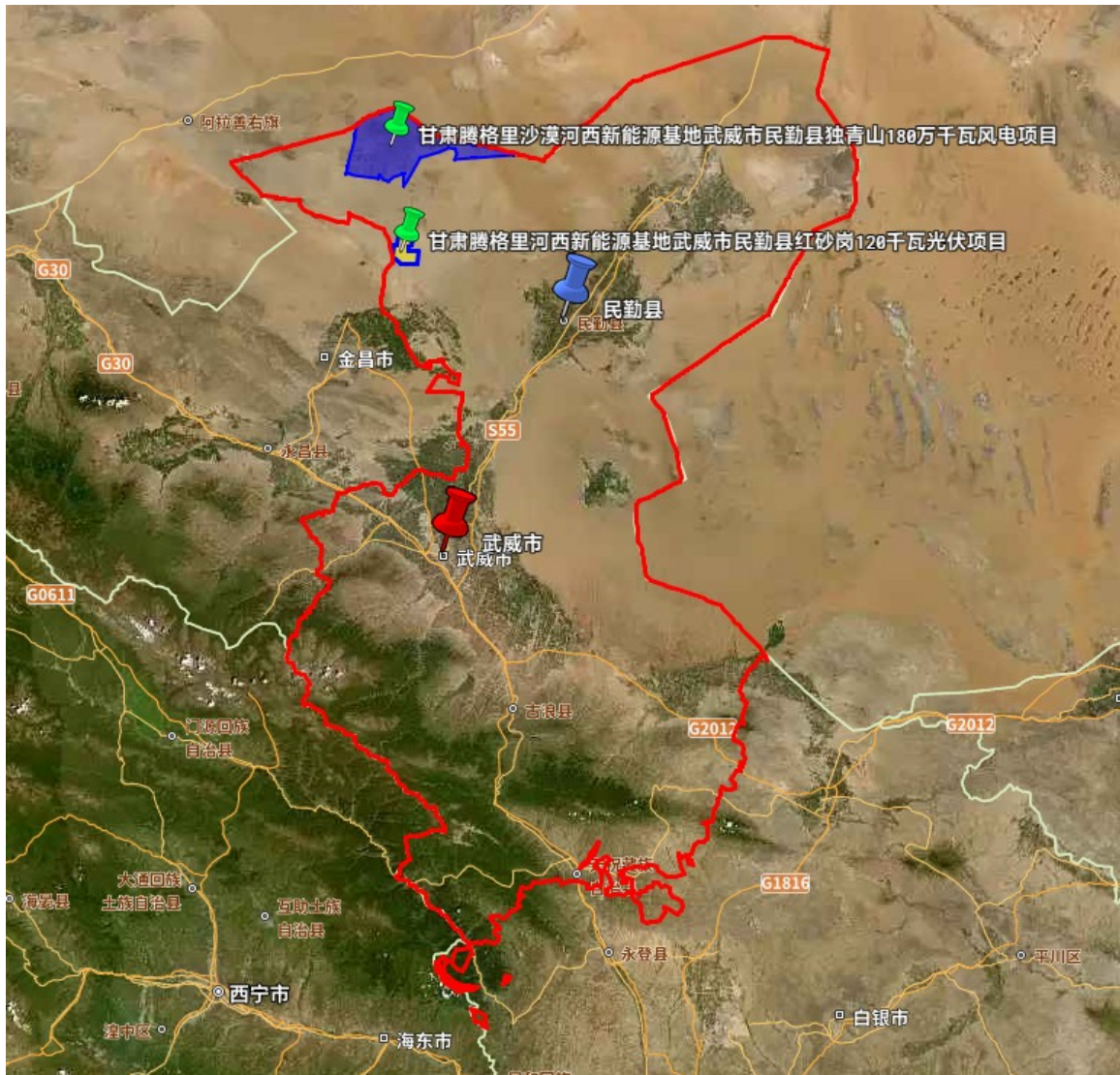
图 2 项目地理位置图

本项目不组织现场踏勘，如投标人需要，可自行前往踏勘。项目选址区域大范围拐点坐标（CGCS2000）如下，具体根据招标人提供的设计方案为准。